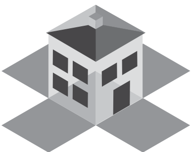
Imagotipo en escala de grises.