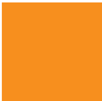
Pantone 130 EC