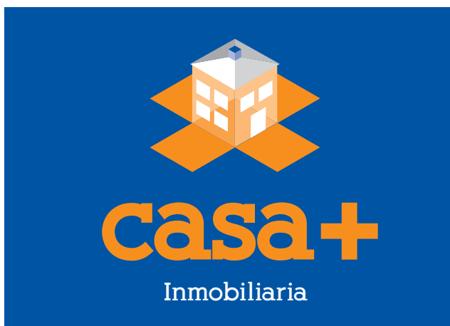
Versión 1ª Marca a todo color sobre fondo corporativo 2