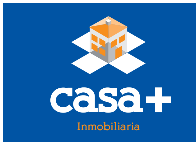
Versión 2ª Marca a todo color sobre fondo corporativo 2