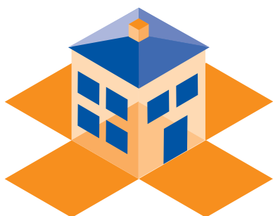
Imagotipo en el color y matices corporativos.