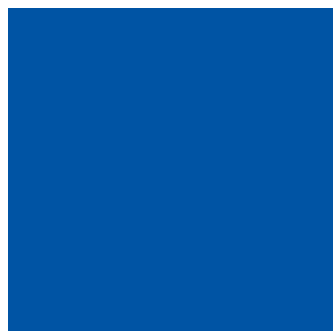
Pantone 2563 EC