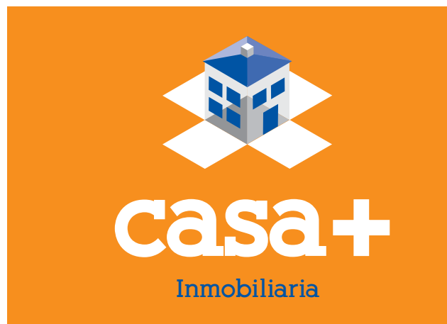
Versión 2ª Marca a todo color sobre fondo corporativo 1