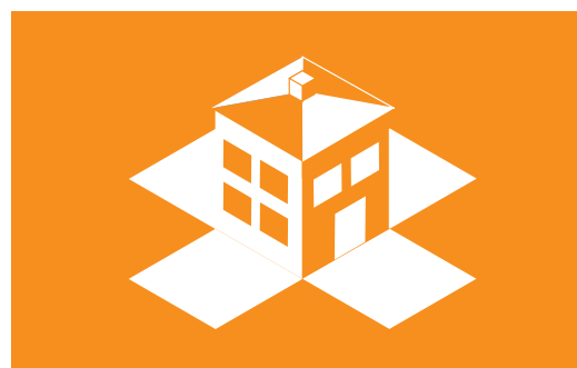
Imagotipo sobre fondo corporativo.