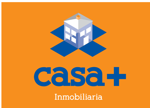
Versión 1ª Marca a todo color sobre fondo corporativo 1