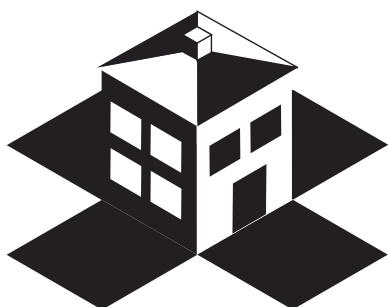
Imagotipo en positivo.