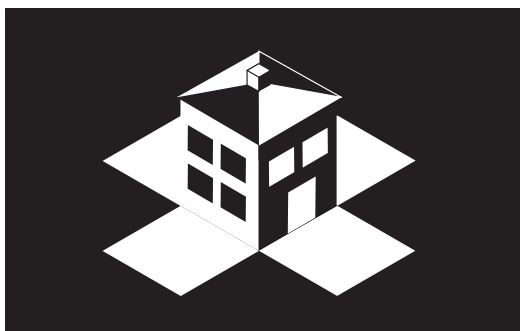
Imagotipo en negativo.